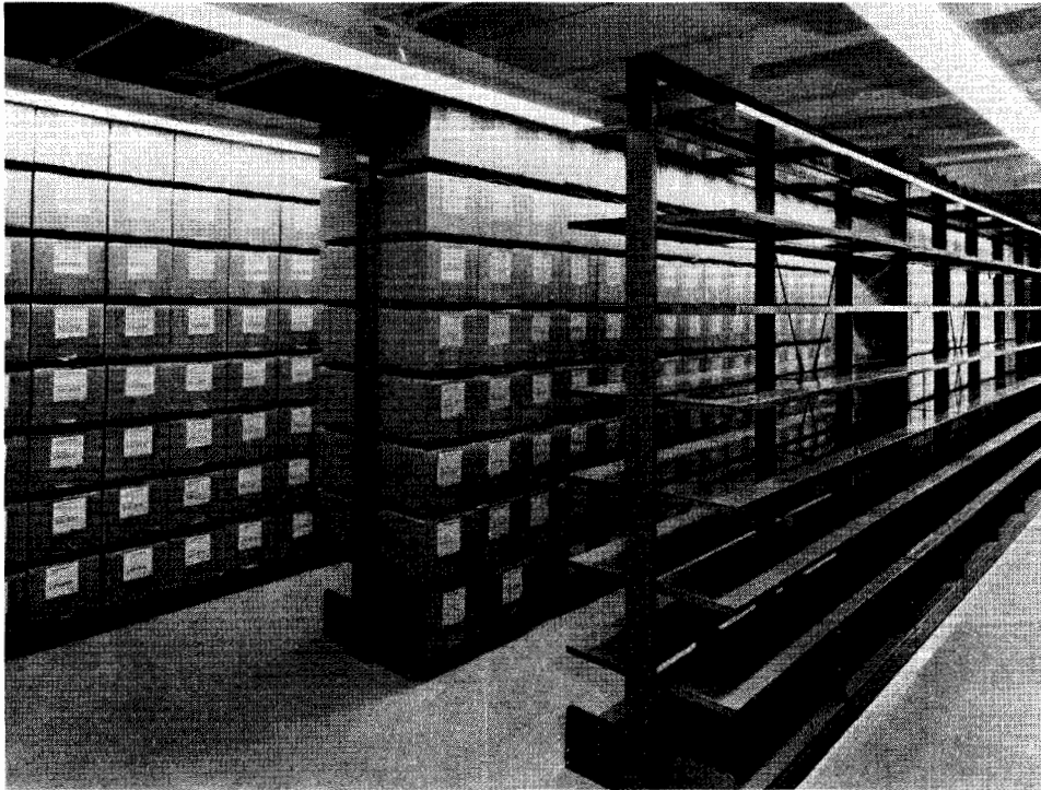
La salle d'entreposage.

nouvel édifice du 395, rue Wellington, la Division des manuscrits et l'ensemble des Archives publiques connurent une grande expansion. Les Archives prirent des dispositions pour se faire officiellement léguer certaines collections en dépôt, et des archivistes professionnels continuèrent, avec leurs aides, à trier, ranger et décrire ces collections de papiers qui avaient appartenu à des personnages politiques.