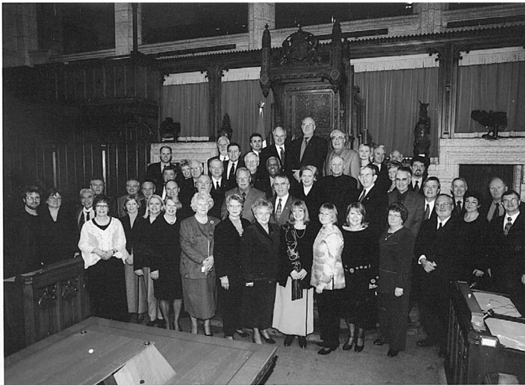
Délégués et observateurs à la 21 e Conférence des présidents d'Assemblée à Ottawa

La Conférence des présidents d'assemblée du Canada avait été organisée de manière à coïncider avec la 17 e Conférence des présidents d'assemblée du Commonwealth, qui s'est déroulée du 9 au 12 janvier. Après l'ajournement de la Conférence des présidents d'assemblée du Canada, tous les présidents d'assemblée ont été amenés à Montebello pour le